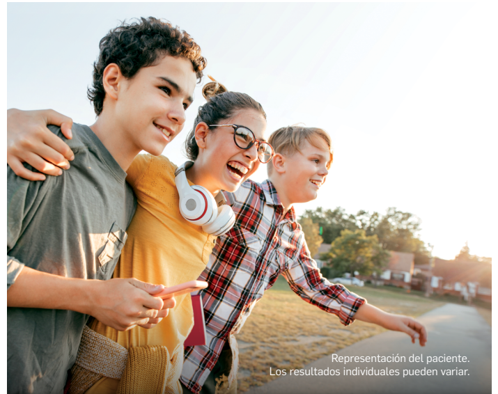
Representación del paciente. Los resultados individuales pueden variar.

PRESIONE AQUÍ PARA VER VIDEOS ► ADICIONALES CON DEMOSTRACIONES SOBRE LA INYECCIÓN.