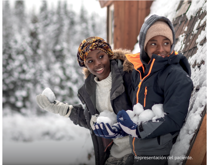
Representación del paciente.

*Se aplican limitaciones. Válido solo para quienes tienen seguro privado. El programa proporciona hasta $16,000 anuales por el costo de COSENTYX y hasta $150 por infusión (hasta $1,950 anuales) por el costo de administración. El apoyo de copago para el costo de administración de la infusión no está disponible en Rhode Island o Massachusetts. Oferta no válida con Medicare, Medicaid o cualquier otro programa federal o estatal. Novartis se reserva el derecho de rescindir, revocar o enmendar este programa sin previo aviso. Consulte los Términos y condiciones para obtener detalles.